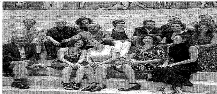
Intérpretes y responsables de la producción operística.

mujeres. En el foso estará esta noche la Orquesta Sinfónica de la Ópera Nacional de Lituania que estará dirigida por Miguel Ortega.