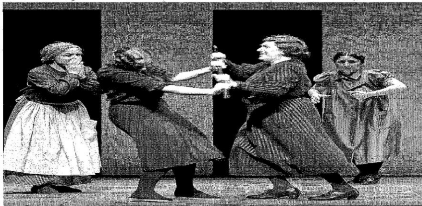
Una de las escenas de la ópera que hoy se estrena.

FESTIVAL INTERNACIONAL DE SANTANDER 58 EDICIÓN